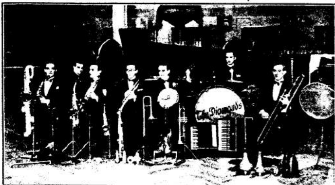
Kapelle Joost „The Diamonds“

Meist trifft man ihn Budapeststraße Nr. 18 - Eden-Hotel-!